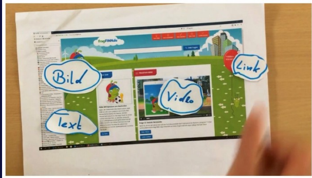
Legefilm zum Thema Kindersuchmaschinen und Browser/Internet (Bild oben)